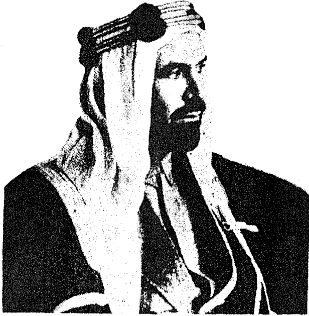
الشيخ أحمد الجابر الصباح

أمضاها مندوب العربية السعودية، يوسف ياسين، ومندوب الحكومة البريطانية ف. ه. و. استونهيور بيرد، نيابة عن مشيخة الكويت.